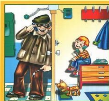
Не разговаривай и не открывай дверь незнакомым людям