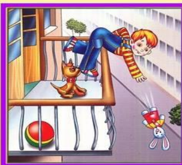
Не играй на балконе, упадешь