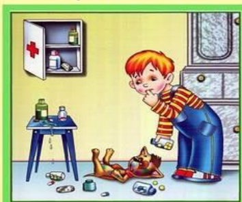
Не трогай таблетки