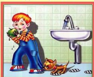
Мойте руки перед едой