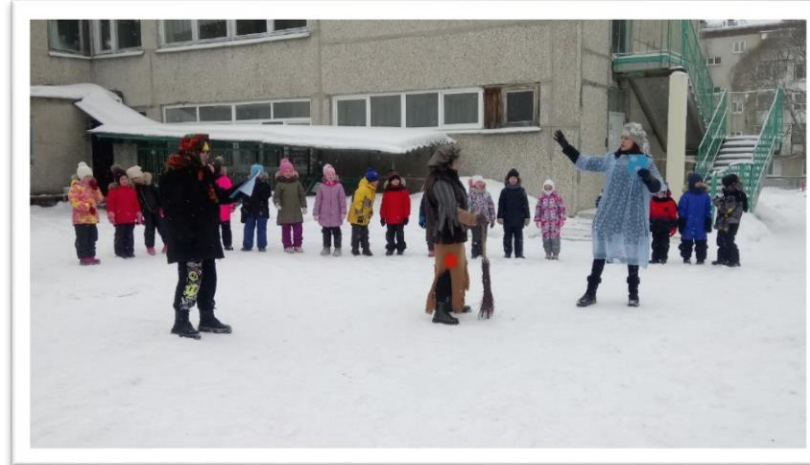
Детям была показана сказка