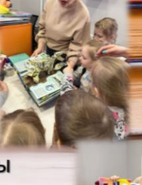
Были показаны необычные книги